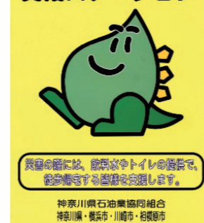
ポスター (ガソリンスタンド)