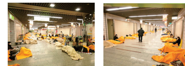
東日本大震災当日の施設への避難者

このため、駅周辺の関係施設などが協力して帰宅困難者対策に取り組んでいるところです。