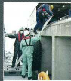
川崎臨海部広域防災訓練の様子