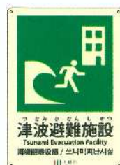
津波避難施設標識