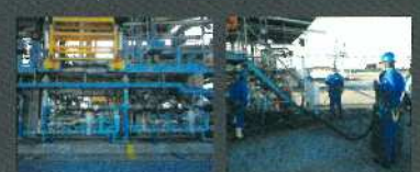
ドラム缶出荷設備 ドラム充填訓練風景

大規模地震発生時においても、石油製品の安定供給を行うべく非常用電源設備・ドラム缶出荷設備の設置や、海上・陸上出荷設備など入出荷機能の補強を行っています。