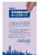
帰宅困難者対策チェックシート