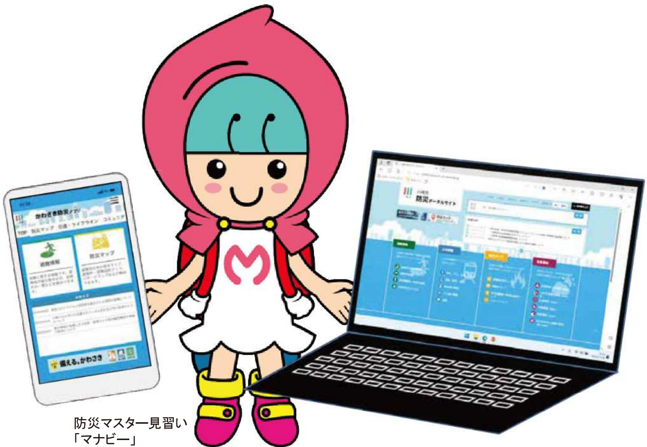
防災マスター見習い 「マナビー」