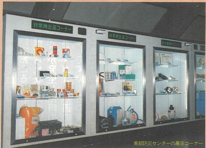
南都方災センターの展示コーナー

いつでも持ち出せるようにして、次のようなものを用意しましょう。トランジスタ・ラジオ、医薬品、下着類、懐中電灯、マッチ、ロソク、缶切り、ビニール袋、手袋、細ひも、貴重品など。電池も定期的に点検することが必要です。