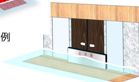
自動ドア前用の例