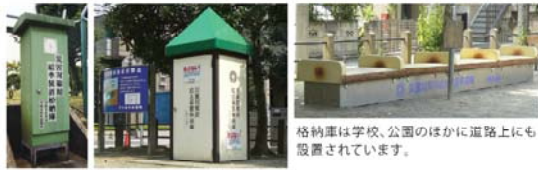
格納庫は学校、公園のほかにも道路にも設置されています。

応急給水拠点には、給水に必要なポンプや蛇口などの器具をしまっておく格納庫があります。地震が起きて断水したときは、格納庫から器具を取り出し、地下に埋めてある貯水槽、貯留管、耐震性に優れた水道管に取り付けて給水します。外出したときにご家庭の近くで格納庫を見つけたら場所を覚えておきましょう。