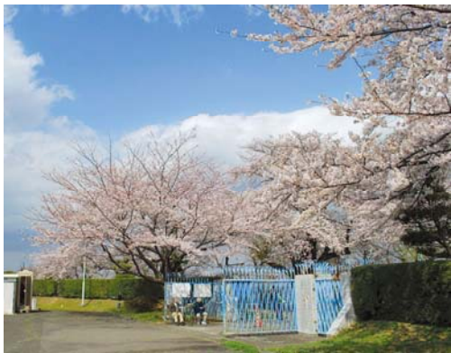
▲ 配水池には桜の木が約50本植えられています。

生田浄水場では、桜の開花に合わせて、配水池の一部を一般開放します。見ごろを迎える桜をぜひご覧ください。