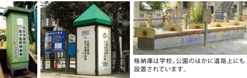
格納庫は学校、公園のほかにも道路上にも設置されています。

応急給水拠点には、給水に必要なポンプや蛇口などの器具をしまっておく格納庫があります。地震が起きて断水したときは、格納庫から器具を取り出し、地下に埋めてある貯水槽、貯留管、耐震性に優れた水道管に取り付けて給水します。外出したときにご家庭の近くで格納庫を見つけたら場所を覚えておきましょう。