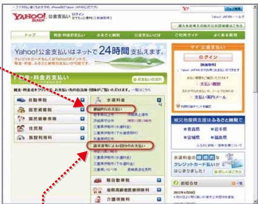
▲「Yahoo! 公金支払い」トップページ