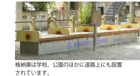
格納庫は学校、公園のほかにも道路上にも設置されています。