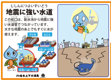
この看板が目印です。