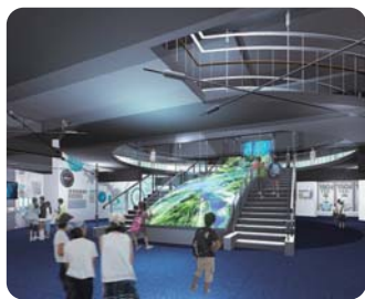
超大型のプロジェクトンマッピング

平成29年6月には、新たに広報施設が開場します。超大型のプロジェクトンマッピングを使用した解説など、ダイナミックな演出を見ながら、学ぶことができるようになります。