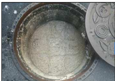
③下水管が完全に閉塞してしまう