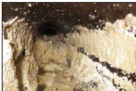
①油脂類が管内で冷えて固まる