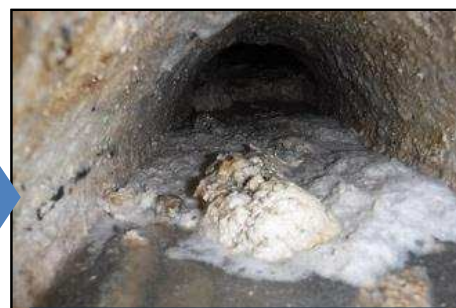
②流れが阻害され汚物が溜まる