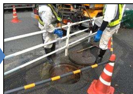
④解消には多大な費用が掛かる

下水管に油脂類を直接流すと、 油脂類が冷えて固まり、下水管を詰まらせる 原因となります。結果、 汚水が道路や敷地などに溢れ出たり、油脂類の腐敗による悪臭など、周辺被害を引き起こす場合があります。 また、 解消作業（清掃等）に多大な費用を要する場合があります。