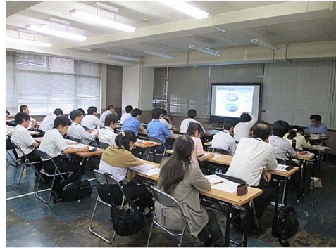
新規採用職員研修の様子