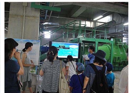
夏休み上下水道教室の様子