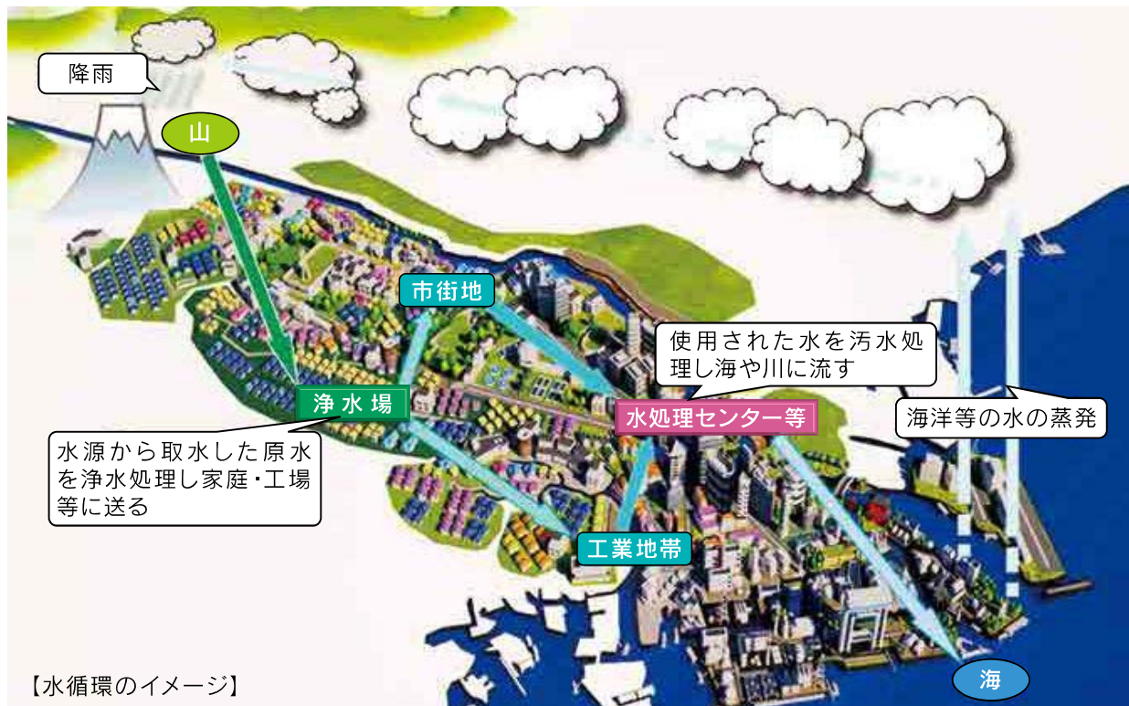
【水循環のイメージ】

本市では、平成22年4月に水道事業・工業用水道事業及び下水道事業を統合し上下水道局を設置しましたが、「水循環を基軸とした環境施策の推進」を統合理念の一つに掲げ、3事業の一体的な取組による地球温暖化対策や資源循環型社会の構築など各種の環境施策に取り組んでいます。