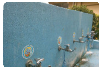
工事を終えた学校の蛇口には、ウォーターンのステッカーが貼ってあります。