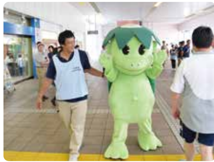
下水道キャラクター「カッピー」も登場します!

かわさき下水道フェア 検索 サービス推進課 ☎ 044-200-3097 ☎ 044-200-3996