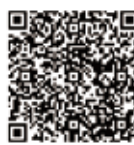
携帯電話用QRコード