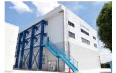
長沢浄水場広報施設の外観