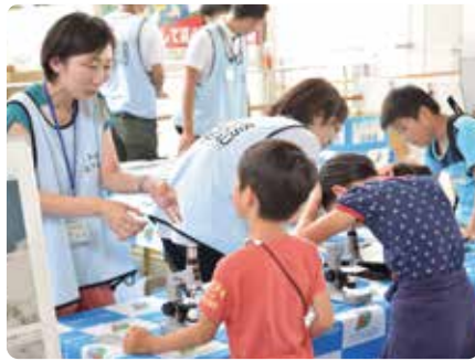
家族で楽しめる内容です!

内容 顕鏡体験、下水道作品コンクール受賞作品や下水道の水処理がわかるパネルの展示など