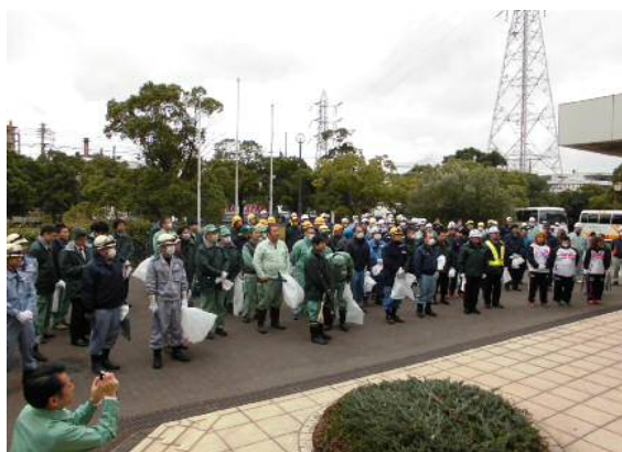
事前集合（入江崎総合スラッジセンター前）