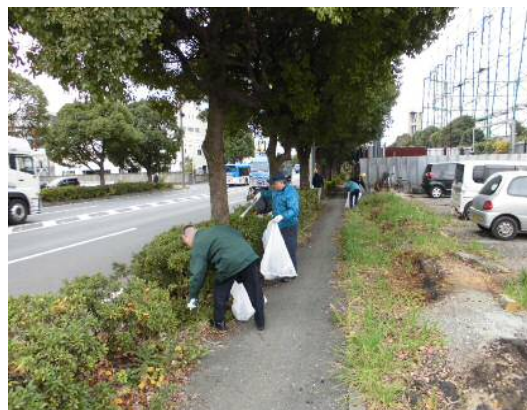
清掃作業①（入江崎総合スラッジセンター周辺）