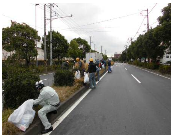
清掃作業②（入江崎水処理センター周辺）