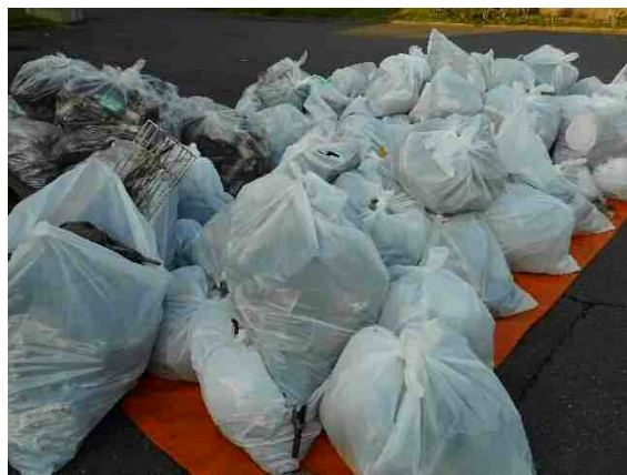
収集したごみ（殿町夜光線）