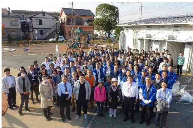
キングスカイフロントからの参加者