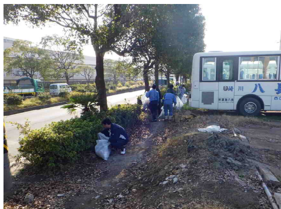
清掃作業①(入江崎水処理センター周辺)