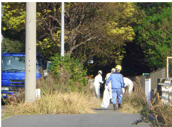
清掃作業②(入江崎水処理センター周辺)