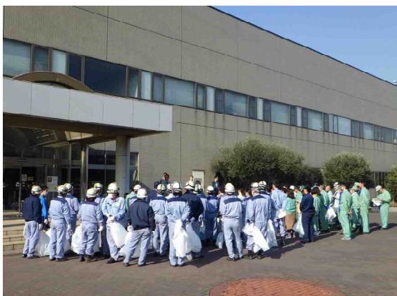
開会式(入江崎総合スラッジセンター玄関前)