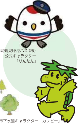
川崎鶴見臨港バス（株） 公式キャラクター 「りんたん」