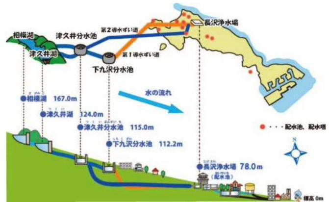
自然流下による水道システム