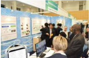
第12回川崎国際環境技術展