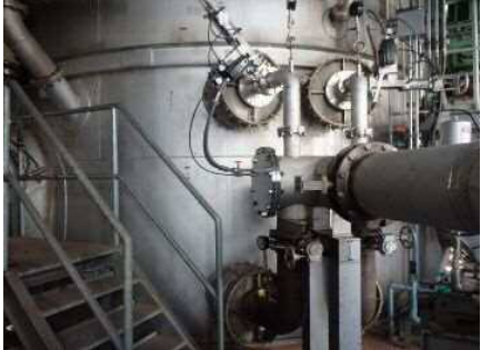
一酸化二窒素と窒素酸化物の削減効果を確認する試験設備