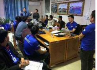
JICA・ラオス「水道事業運営管理能力向上プロジェクト(MaWaSU2)」