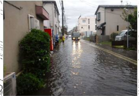
写真：小田3丁目地内 浸水状況写真

京町・渡田地区の小田3丁目地内は、平坦な地形であり、過去10年間の浸水実績が特に集中しているため、早期の対策が求められております。 このため、当該地内の導水管整備を先行的に進め、浸水被害を軽減させます。