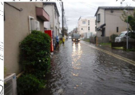
写真：小田3丁目地内 浸水状況写真

京町・渡田地区の小田3丁目地内は、平坦な地形であり、過去10年間の浸水実績が特に集中しているため、早期の対策が求められています。 このため、当該地内の導水管整備を先行的に進め、浸水被害を軽減させます。