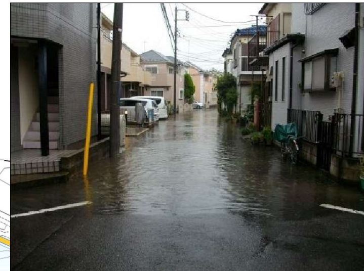
写真：菅北浦地区 浸水状況写真