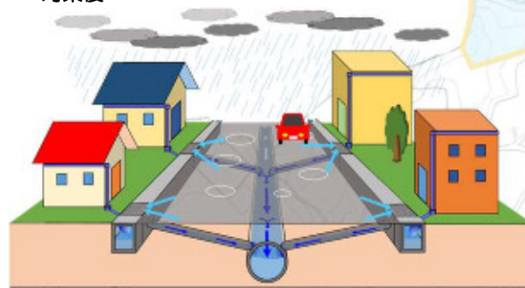
図：浸水対策のイメージ図