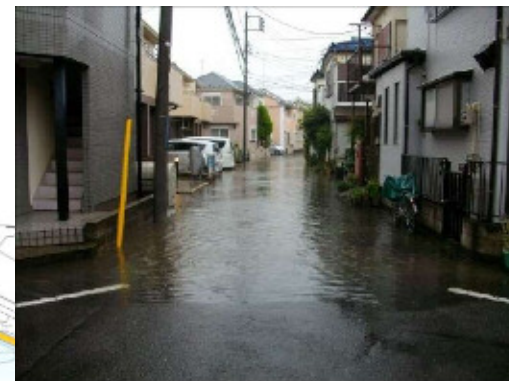
写真：菅北浦地区 浸水状況写真

当該地区は、三沢川を境に北側の菅・菅稲田堤地区と、南側の菅北浦地区に、大きく二分されます。どちらも平坦な地形であり、既存の排水施設の能力が不足しています。