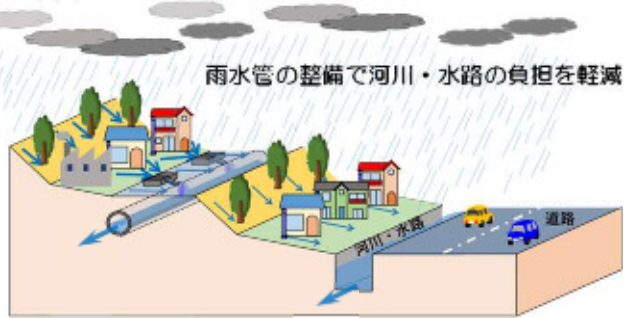
図：浸水対策のイメージ図