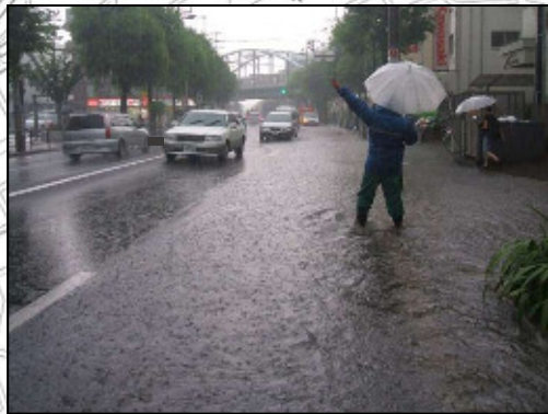
写真：尻手黒川道路 道路冠水状況写真

土橋1丁目、2丁目地区は、丘陵地に降った雨水が、尻手黒川道路沿いなどの低地部に集中して過去に浸水被害が発生しています。 このため、雨水が低地部に集中しないよう、新たに雨水管を整備して浸水被害を軽減させます。