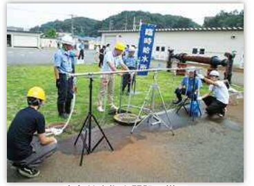
応急給水拠点開設の様子

応急給水拠点の開設時には、市民の皆さまが居住している場所から約750メートル以内で給水を受けることができます。また、現在、より迅速かつ利便性の高い給水を行うため開設不要型応急給水拠点の整備を進めています。