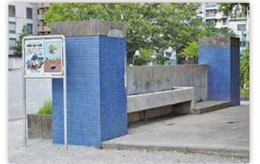
開設不要型応急給水拠点 (既設水栓利用型)

応急給水拠点で給水を行う場合、通常は格納庫等に収納されている給水器具などを組み立てる必要があります。職員による開設が不要な開設不要型応急給水拠点は、災害時に避難所となる小中学校などで、蛇口をひねるだけで給水を受けることができます。