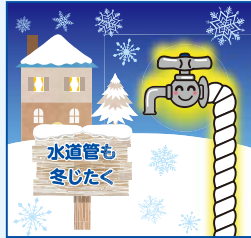
水道管の凍結対策

急に熱い湯をかけると、水道管や蛇口が破裂することがあります。自然に溶けるのを待つか、ぬるま湯でゆっくりと溶かしてください。なお、水道管の凍結予防については、上下水道局ウェブサイトでもご確認ください。