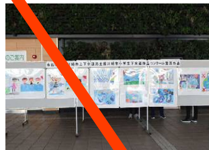
令和元年度作品コンクール受賞作品展示