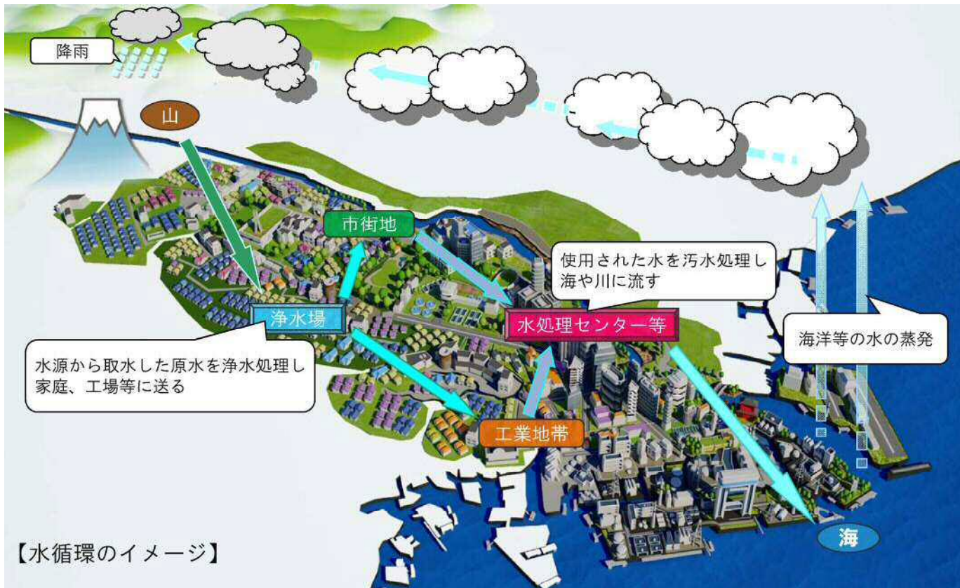
【水循環のイメージ】

川崎市では、平成22(2010)年4月に水道事業、工業用水道事業及び下水道事業の組織を統合した上下水道局を設置し、「水循環を基軸とした環境施策の推進」を統合理念の一つに掲げ、3事業の一体的な取組による地球温暖化対策や資源循環型社会の構築など各種の環境施策に取り組んでいます。