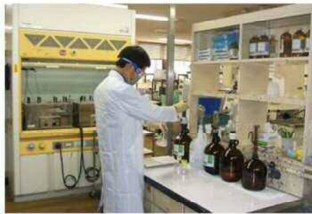
水処理センターでの水質試験の様子