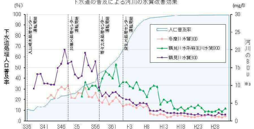
下水道の普及による河川の水質改善効果

※BODとは、水の汚れを表す指標で、一般的に数値が大きいほど水が汚れており、数値が小さいほどきれいな水であるといえる。