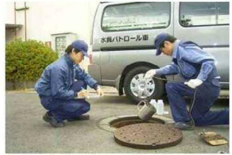
事業場での水質検査の様子