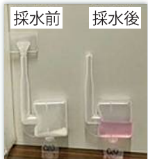
簡易水質検査キット