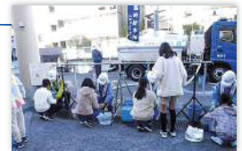
給水タンク車からの応急給水体験

応急給水拠点や給水タンク車から給水袋に水を汲んでいただき、被災時の応急給水の様子や水を入れた給水袋の重さを実際に体験していただいています。