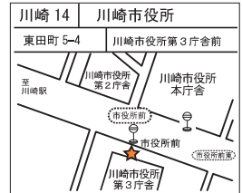
(例)川崎区にある拠点の地図

応急給水拠点とは、地震などの災害で断水が起きたときに市民の皆さまに水をお配りする場所のことです。開設時には市民の皆さまが居住している場所から約750メートル以内で給水を受けることができます。応急給水拠点は、市内に254箇所（令和4年4月1日現在）整備されています。