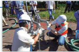
応急給水拠点の開設

自主防災組織等には、格納庫に収納された給水器具の取出しから給水器具の組立、水質確認に至るまでの一連の開設作業を体験していただいています。