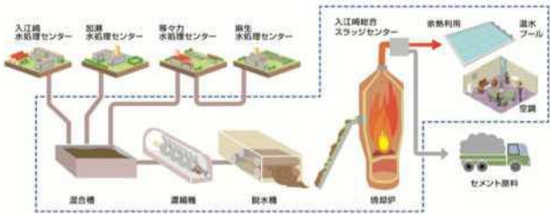
下水汚泥焼却処理工程から発生する資源・エネルギーの利活用のイメージ