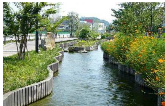
江川せせらぎ水路

○川崎ゼロ・エミッション工業団地、近隣事業者に高度処理水を提供 ○高度処理水を江川せせらぎ水路に送水 ○高度処理水を機械の冷却水等に利用