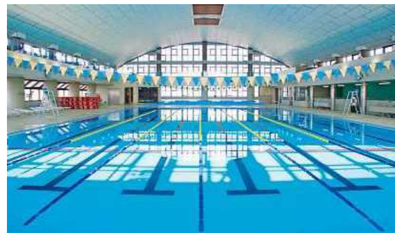
入江崎余熱利用プール