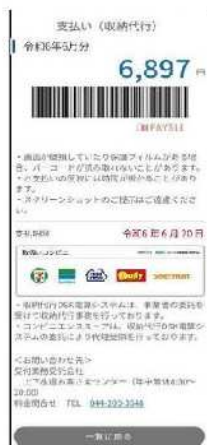
PAYSLEのバーコード画面

PAYSLEのご利用可能コンビニ セブン-イレブン、ファミリーマート、ミニストップ、 デイリーヤマザキ、セイコーマート