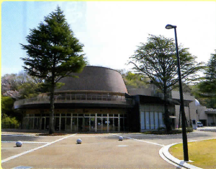
プリンのような外観と生田緑地の木々の緑に囲まれた「かわさき宙と緑の科学館」