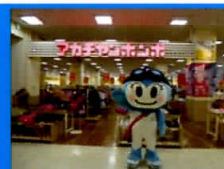
7月7日アカチャンホンポ 1日店長を務めました!