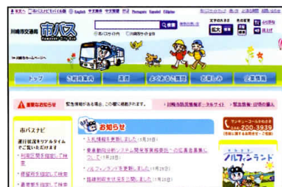
リニューアル後の市バスホームページのトップページ

10月15日に、市バスホームページをリニューアルしました！新しいホームページでは、ウェブアクセシビリティに配慮するとともに、コンテンツを整理し、「より使いやすく、分かりやすい」ホームページとなっています。是非、ご利用ください。