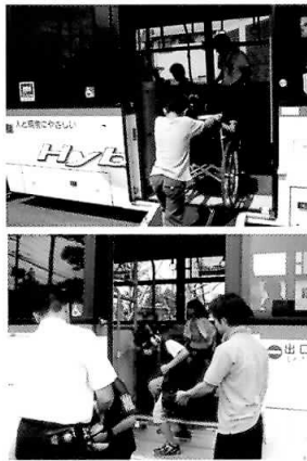
車いすや高齢者疑似体験グッズを使用して、バスの乗り降りをする様子