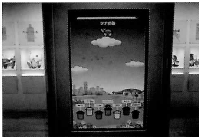
タッチパネル式のゲームで、ごみの分別にチャレンジ！