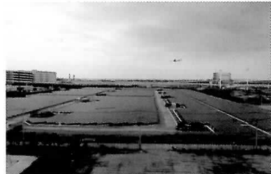
展望スペースから見た浮島太陽光発電所

かわさきエコ暮らし未来館は、地球温暖化、再生可能エネルギー、資源循環の3つのテーマを中心に、環境問題について、「見て、聞いて、触って学べる」施設として、昨年8月にオープンしました。