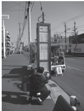
藤崎一丁目の停留所清掃の様子