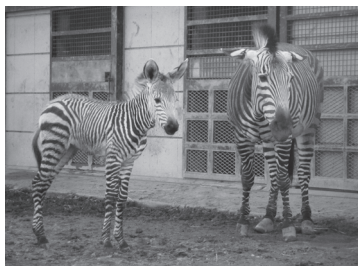
ヤマシマウマの親子。かわいい赤ちゃんに、ぜひ会いに来てください。

夢見ヶ崎動物公園には、レッサーパンダやフンボルトペンギンなど61種類約440点の動物たちが飼育・展示されています。