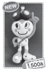
かわさきノルフィンぬいぐるみ 1個 1,500円(税込)