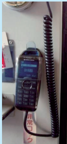
バス車内に設置した非常時連絡用無線機

市バスでは、大規模災害発生時に、安定した連絡体制を確保し、お客様の安全と運行状況を的確に把握するため、非常時連絡用無線機を全車に導入いたしました。