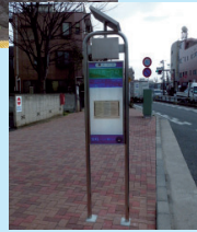
山王町一丁目に設置したソーラー標識