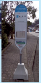
久末住宅前に設置した二面式標識