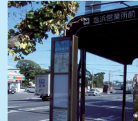
塩浜営業所前に設置した照明付標識