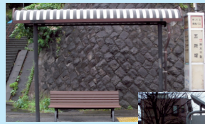
五所塚に設置したベンチ