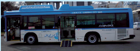
平成24年度に導入したハイブリッドノンステップバス