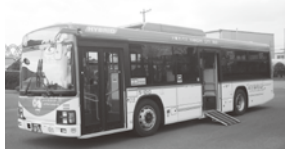
▲地球環境に優しいハイブリッドバス