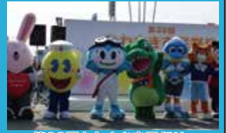
第38回かわさき市民祭り 開会式に登場しました!