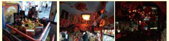
バスの車外も車内もハロウィン仕様♪ 夕方になると、オレンジ色の灯りがより一層輝きます。

お問い合わせ先 ▶管理課 Tel:044-200-3238 ▶塩浜営業所 Tel:044-288-0972