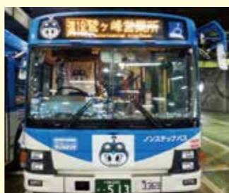
▲ヘッドマークもノルフィン仕様。ダッシュボードにはノルフィンが沢山☆

ノルフィン一色の装飾に、ご乗車されたお客様からは「スゴイ!」や「かわいい!」などの感想が聞かれ、楽しんでいただきました。