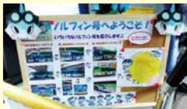
▲バス車内にノルフィン登場! 子どもたちにも大人気!