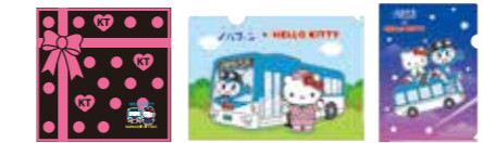
ハンドタオル(左)とクリアファイル(中央・右)のオリジナルコラボグッズ。市バスでしか買えません!

© 1976, 2016 SANRIO CO., LTD. APPROVAL No. G563815