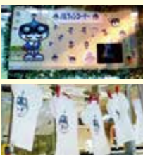
▲車内には、運転手手作りの様々な工夫あふれる装飾がいっぱい!

また、ご乗車されたお子様には、ノルフィンのぬり絵やすごろくなどが入った特製のクリアファイルをプレゼントしたり、サプライズでノルフィンが乗車したりと、期間中はお客様に喜んでいただける取組となりました。