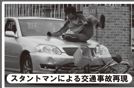
スタントマンによる交通事故再現

市バス運転手と教習所教官が、教習所内の難関コースで洗練された運転技術を披露・観戦しよう！(11時30分終了)