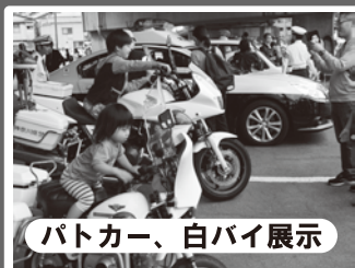
パトカー、白バイ展示