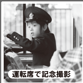
運転席で記念撮影