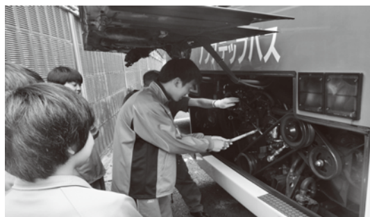
エンジンルーム点検を体験(向丘中学校2年生)

参加した中学生からは「職員の方がとても安全に気を付けていることが分かった」「今回の体験を通じて、自分の夢を見つけていきたい」等の感想が聞かれました。今後も市バスでは、地域貢献の活動を行っていきます。