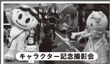
キャラクター記念撮影会

ヌルフィン、ハローキティ、ふるん太が登場 (①10時②12時③14時～各回約30分実施)