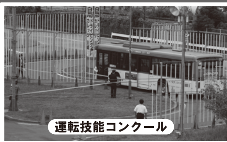
運転技能コンクール

市バス運転手と教習所教官が、教習所内の難関コースで洗練された運転技術を披露・観戦しよう！(11時30分終了)