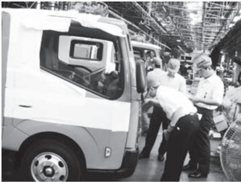
消防車両の検査を行う施設装備課員