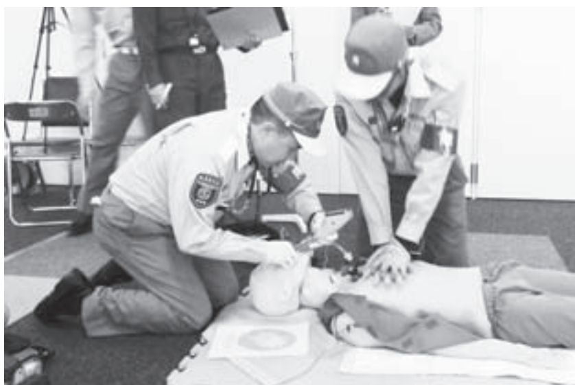
ビデオ硬性挿管用喉頭鏡による気管挿管訓練中の救急救命士