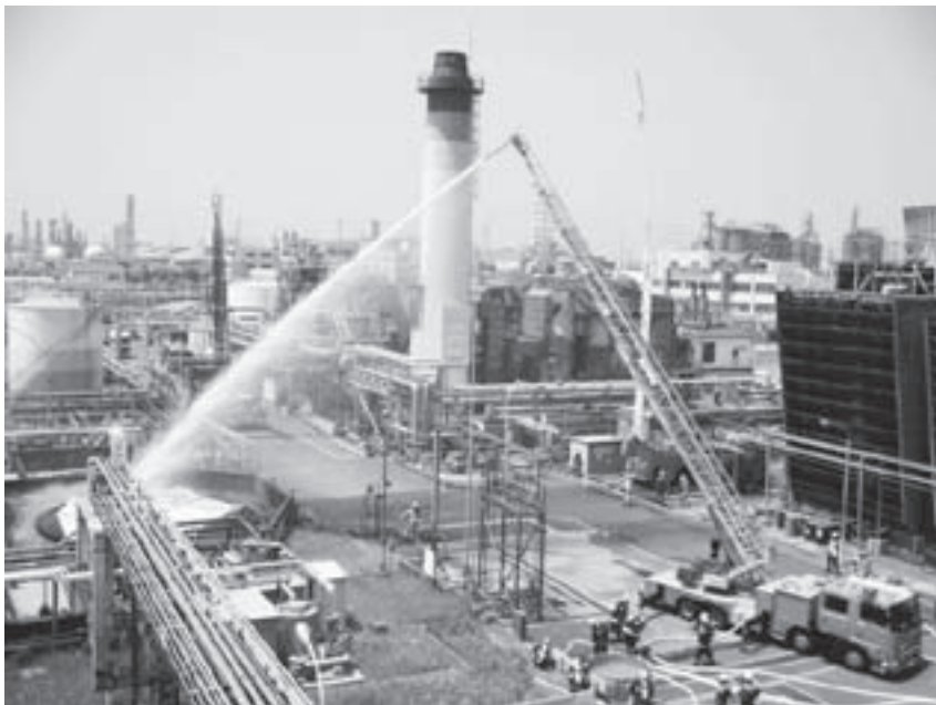
石油コンビナート等特別防災区域における泡放射訓練