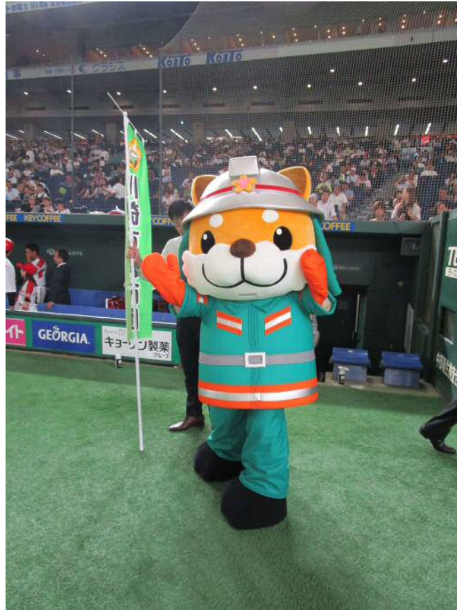
「太助」都市対抗野球応援（東京ドームにて）