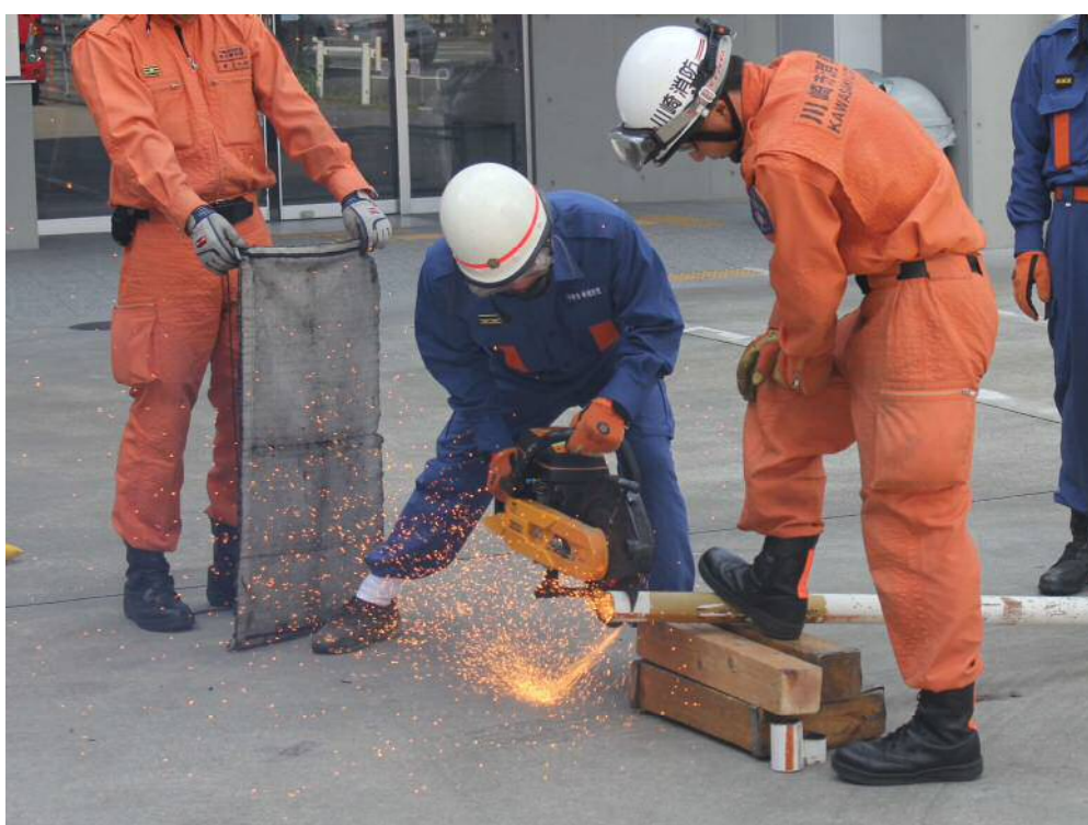
救助器具取扱訓練