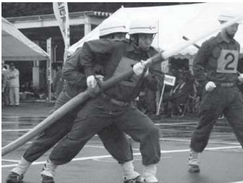
川崎市消防団操法大会